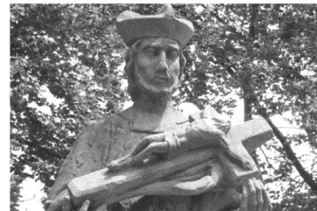
Brückenheiliger und Patron des Beichtgeheimnisses

Am 16. Mai feiert die Kirche das Fest des heiligen Johannes Nepomuk. In einem kirchenpolitischen Konflikt wurde er 1393 von der Prager Karlsbrücke in den Tod gestürzt. Dass er getötet worden sei, weil er mit seinem Leben die Wahrung des Beichtgeheimnisses verteidigt hätte, ist legendär.